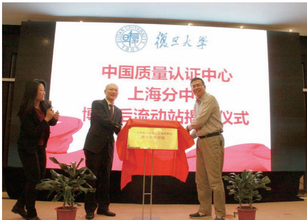
认证中心与复旦大学举行博士后流动站揭牌仪式

2016年12月13日,复旦大学—中国质量认证中心上海分中心博士后流动站在上海正式揭牌。认证中心将与复旦大学一起推动校企联动发展的新型模式,加强与高等院校间的交流,积极引入科研技术力量,深化产学研合作、推动协调创新,共同开拓在新能源、节能环保、电工产品等方面新技术服务的合作,进而实现技术、人才等创新要素的集约集聚和优化配置,增强彼此间共同承担的社会责任,引导行业发展和技术提升。