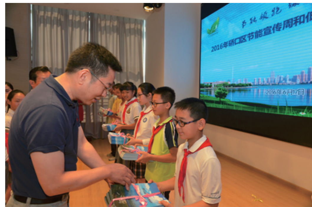
武汉分中心负责人为小学生发放节能宣传材料

在武汉，认证中心与硚口区联合开展了“生态校园建设”低碳示范项目。认证中心武汉分中心专门组织力量，从应对气候变化的角度，通过编制宣传册，拍摄面向中小学生的应对气候变化教育宣传片，制定生态校园标准，邀请低碳专家进课堂等多种方式，加强中小学生的生态教育，希望通过“青少年带领家庭、家庭辐射社会”的途径，让每个公民在日常生活中融入应对气候变化的行动，逐步做到全民参与应对气候变化行动。