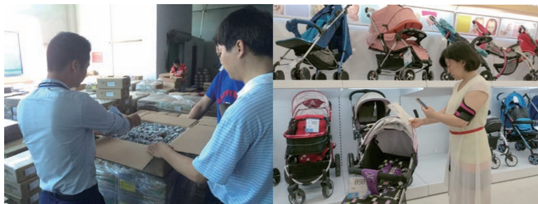
认证中心开展市场买样活动

认证中心为进一步扩大公信力和影响力，有效践行社会责任，从2011年开始至今，连续6年拨付专款开展市场买样检测活动，利用认证中心电子化平台，调取型式试验报告，采用“产品一致性核查+检测”的模式，开创了国内认证机构开展市场买样检测工作的先河，不仅震慑了不诚信企业，降低了认证风险，还推动了证后监督的创新发展，成为证后监督的重要补充手段，为降低认证风险，促进企业提高认证产品质量起到了积极的推动作用。