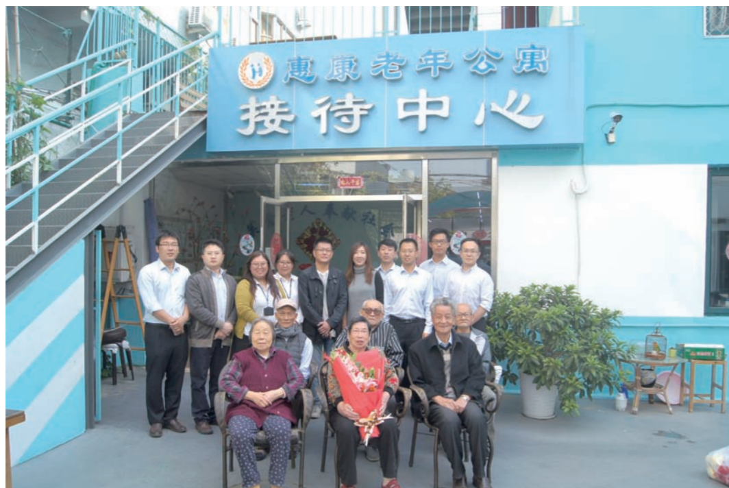
青岛分中心志愿者与老人合影留念

10月10日上午，认证中心青岛分中心组织开展了“九九重阳节，浓浓敬老情”的重阳送温暖活动。分中心“青年文明号”成员一行9人到青岛市市南区惠康养老院看望老人，与老人们亲切交流、聊天、拉家常，详细询问了解老人们的生活、健康状况，与爱好台球的88岁老人切磋球技，听老人讲述体育人生，并为老人们献上鲜花、水果、牛奶等物品。