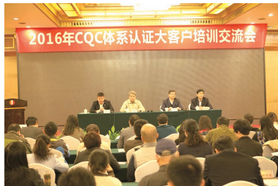
认证中心举办体系认证培训交流会

管理方面 ISO 9001：2015 质量管理体系标准和 ISO 14001：2015 环境管理体系标准于 2015 年 9 月份正式发布。为帮助体系认证客户顺利实施换版工作，认证中心于 2016 年召开体系认证大客户培训交流会，组织专家分别就 ISO9001 和 ISO14001 新标准换版升级要点与难点进行了解析，邀请成功转版客户进行了转版经验交流和答疑，并对质量管理体系成熟度评价、ISO 55001 资产管理体系标准应用与推广等 8 项 CQC 新认证业务进行了介绍。