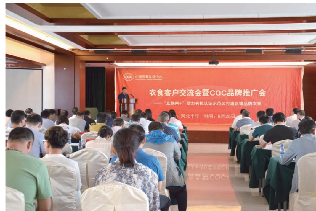
有机客户交流活动现场

2016年10月，认证中心在河北省丰宁县召开农食客户交流活动。活动以“互联网+助力有机认证示范区打造区域品牌农业”为主题，围绕“互联网+平台服务有机认证示范区”的主题，分别从如何建立“品牌农业”、如何利用互联网助力有机认证示范区打造区域品牌农业、有机农业示范区与电商平台“区域产品特色馆”如何对接、示范区内食品农产品品质保证措施等四个方面展开讨论，来自有机认证示范区的代表也分享了在示范区创建方面的经验。认证中心通过在不同类型客户之间搭建信息传递桥梁，及时了解了客户需求，为客户提供增值服务，扩大了机构与企业的合作领域，也助力了行业发展。