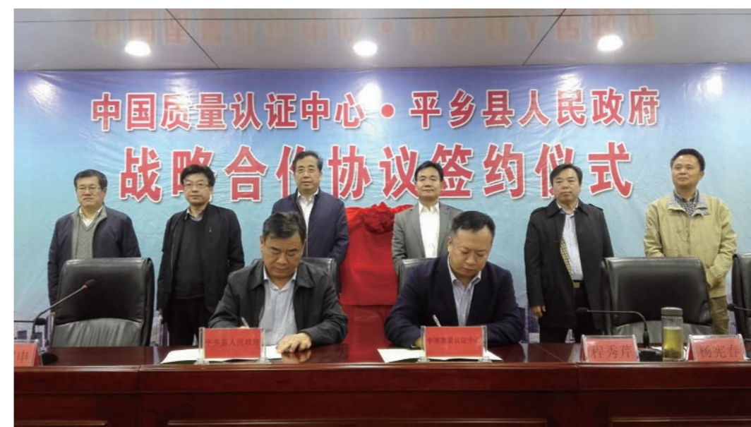
认证中心与平乡县合作协议签署现场

2016年10月,认证中心与河北省平乡县人民政府签署了战略合作框架协议,在CCC认证、CQC标志认证、国际认证、电商平台质量服务、节能低碳服务、定制化质量技术服务、企业服务等领域开展战略合作,并为平乡提供第三方技术服务,促进县域管理和服务水平提高,推动县域企业发展,开启自行车、童车产业“+检测认证”新模式,全面提升该县自行车、童车产业项目产品质量、服务质量,服务地方经济转型升级,支持“品质平乡”品牌建设。