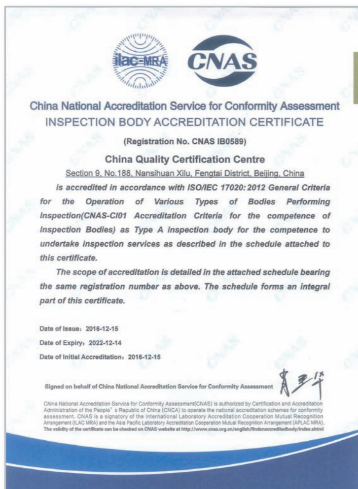
认证中心获得 CNAS 认可证书

2016 年 12 月，认证中心获得了中国合格评定国家认可委员会（简称 CNAS）ISO/IEC 17020 检验机构认可，认可范围覆盖光伏发电系统和风能发电系统，成为国内首家通过光伏和风能检验机构资质双认可的机构。检验检测认证资质的完备满足了国际电工委员会可再生能源认证体系 (IECRE) 关于机构开展光伏系统认证和风电系统认证的全部技术要求。认证中心出具的评定结果将会在相关多边互认体系中被承认，进而助力新能源产业国际化发展。