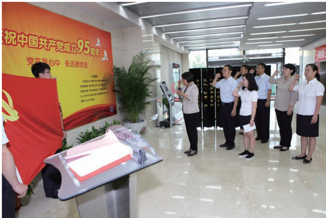
“七一”党的生日预备党员宣誓

为庆祝中国共产党成立 95 周年，认证中心在 2016 年“七一”党的生日来临之际隆重举行预备党员宣誓仪式，激励广大党员坚定理想信念，坚守共产党人的精神追求，牢固树立党全心全意为人民服务的宗旨，在工作、学习和社会生活中充分发挥先锋模范作用。