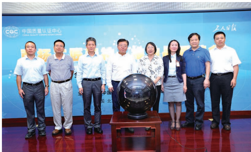
认证中心与工人日报社共同开启质量知识普及竞赛活动

9月13日,认证中心与工人日报社联合开展了主题为“弘扬工匠精神 推动品质革命”的“2016全国‘质量月’质量知识普及竞赛”活动,深入贯彻落实党的十八大以来一系列方针政策和习近平总书记系列重要讲话精神,主动适应和引领经济发展新常态,动员全社会增强质量意识,积极参与质量强国建设事业。