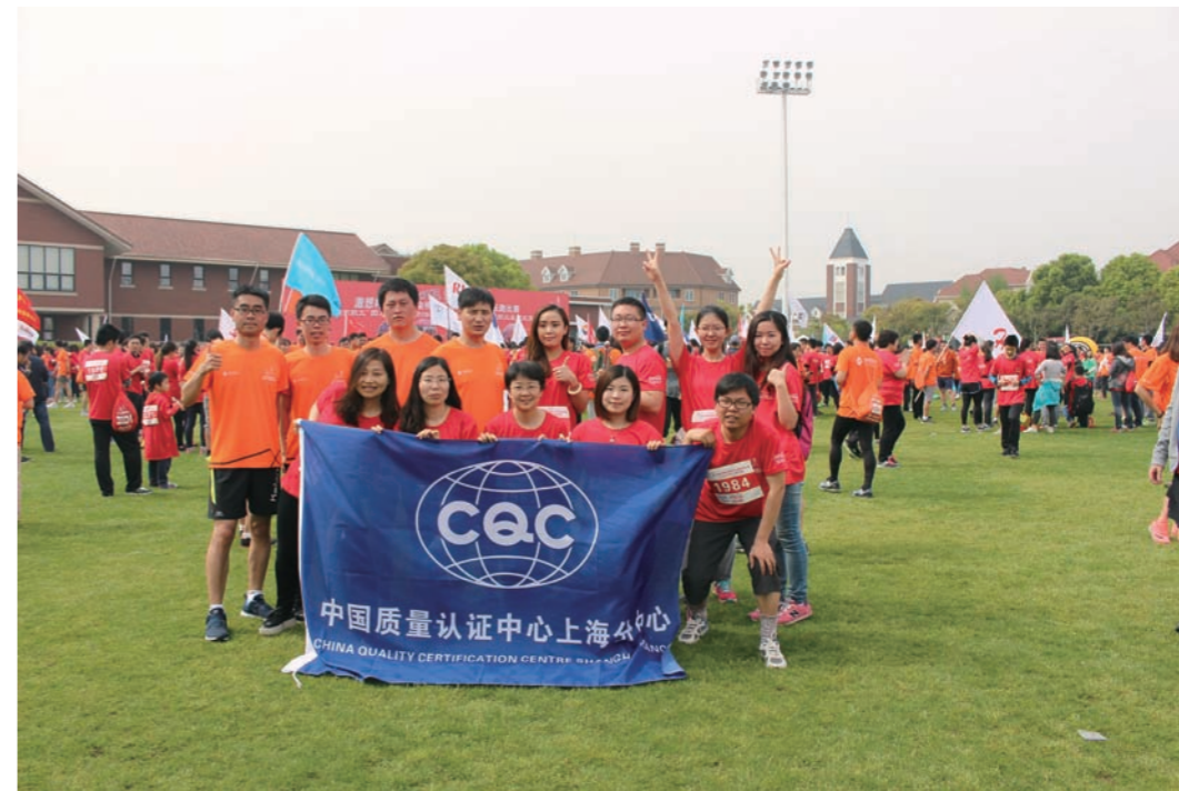
上海分中心长跑活动现场

4月10日，认证中心上海分中心作为检测认证行业代表积极参与第十五届金桥碧云国际社区中外职工长跑比赛，以饱满的热情完成了8公里竞技跑和3公里欢乐跑的比赛，用实际行动倡导广大民众关注环保公益事业，追求健康生活理念，并传递了热爱生活、积极乐观的正能量。