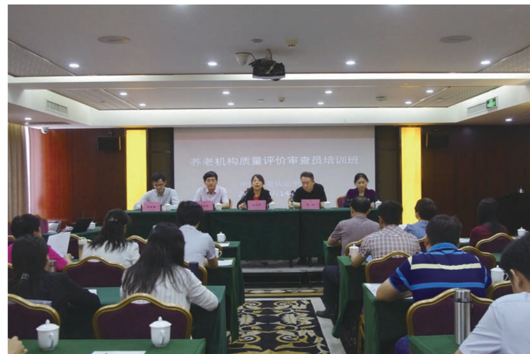
认证中心开展养老服务课题研究和培训

服务认证 认证中心在2015年11月发布了国内首个养老机构服务质量第三方评价标准(CQC9101-2015)的基础上，2016年顺利通过《养老服务认证制度和技术体系框架建立研究》《中国养老服务业市场潜力、投融资及标准化政策研究》《中国养老服务业专业人才培养政策建议与养老服务评价关键技术研究》等课题验收，对于加快我国养老服务业标准体系建立、构建我国养老服务质量第三方评价机制以及促进养老服务业规范发展具有重要意义，并开发了《养老机构质量评价审查员》和《养老服务质量管理高级研修》培训课程，举办三期审查员培训班，培养90余人。