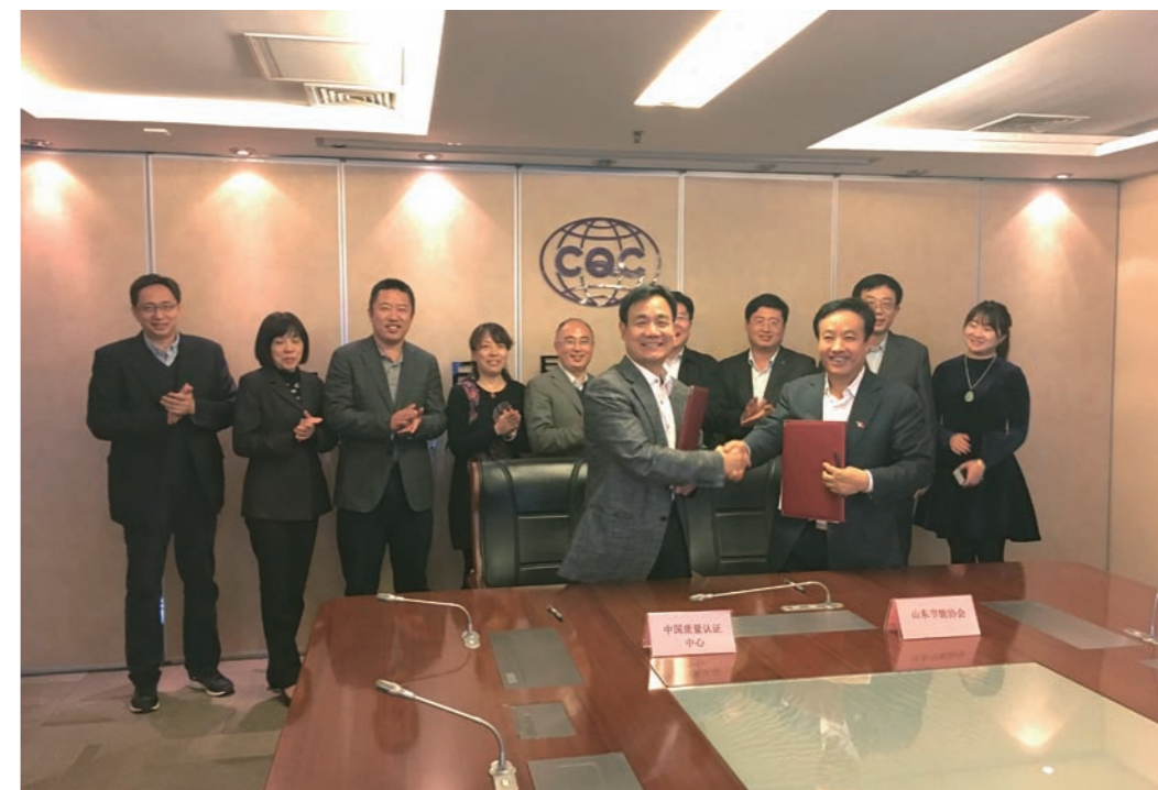
与山东省节能协会战略合作框架协议签约仪式

认证中心举办了全国碳市场《温室气体排放核算方法与报告指南（试行）解析课程》教师及核查员培训班，为全国碳市场建设提供技术和人员保障，配合国家发改委气候司和各地方碳市场能力建设认证中心推进碳市场建设工作，提供包括制度设计、核查、培训、科研等专业服务，不断取得新成效。