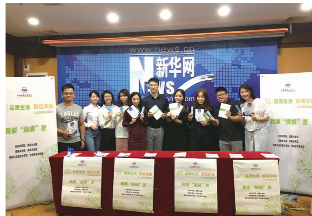
认证中心走进各类媒体开展全国“质量月”线下宣传活动