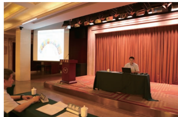
《温室气体排放核算方法与报告指南（试行）》解析系列教材发布会