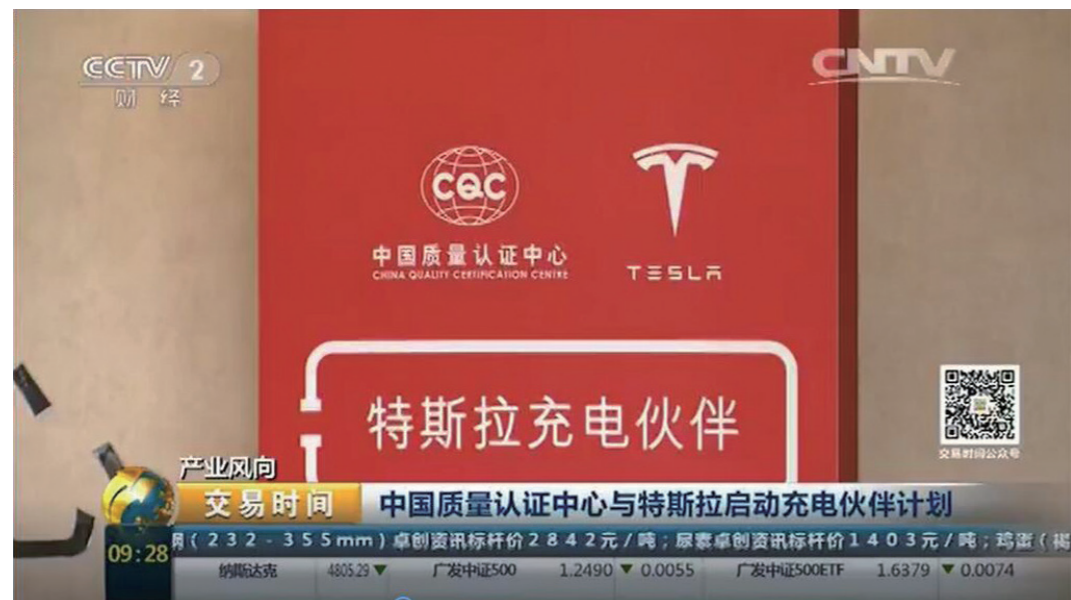
央视财经频道对活动进行报道

产品方面 为推动国家质检总局、国家标准委联合国家能源局、工信部、科技部等部门于2015年年底联合发布的新修订 GB/T 18487.1-2015《电动汽车传导充电系统 第1部分：一般要求》等五项充电新国标落地，认证中心与特斯拉于2016年4月在北京启动了“特斯拉充电伙伴计划”。该计划将获得 CQC 证书，且带有 CQC 标志作为特斯拉面向社会选择符合国标充电桩的前提。