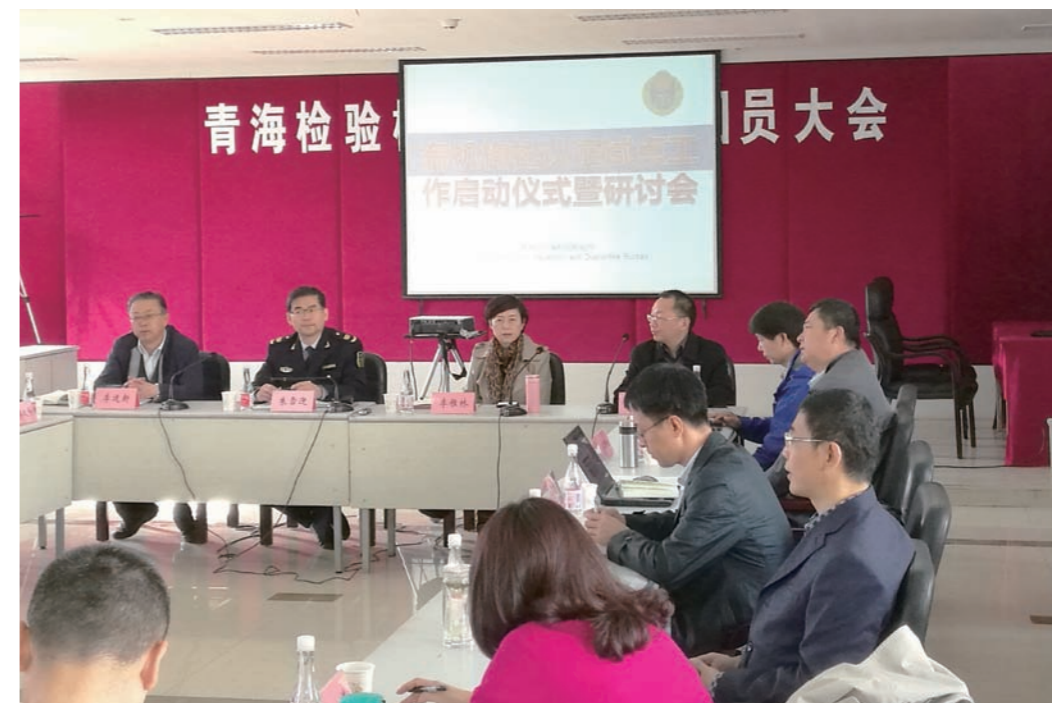
认证中心召开“有机枸杞认证试点工作启动会暨研讨会”

认证中心为帮扶青海省枸杞生产经营企业，促进产品质量提升和品牌推广，组织人员对企业进行有机产品认证和良好农业规范认证实施培训，并组织3个检查组约30人次对企业的生产过程、产品质量控制、风险管理等进行现场检查，以督促和建立枸杞生产经营企业的质量控制体系。