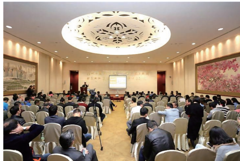
(广州) 全国绿色校园——节能低碳工作培训会现场

认证中心与教育部学校规划建设发展中心在广州举办“2016年全国绿色校园——节能低碳工作培训会”，并组织对华南理工大学、中山大学节能改造项目的实地考察，推动节约型校园向绿色校园迈进，提高节能工作理念、管理和技术水平。