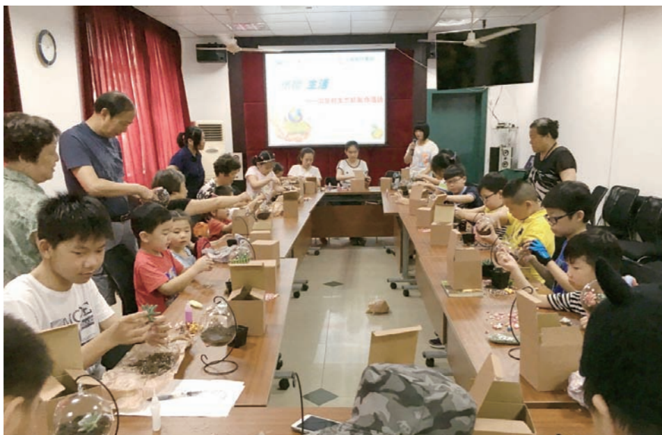
上海分中心举办“社区低碳行”系列活动