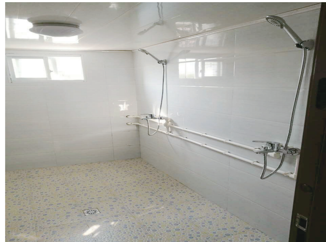
上海分中心为定点捐助小学进行的淋浴改造工程