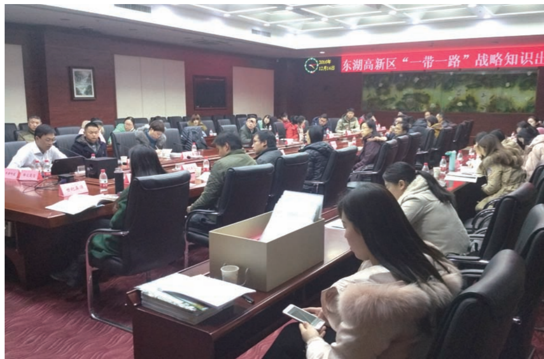
认证中心为武汉东湖高新区中国光谷企业开展“一带一路”战略出口业务培训

2016年12月14日，认证中心国际业务部和武汉分中心为中国光谷企业免费举办了“一带一路”战略出口业务培训，引导武汉中国光谷企业紧随“一带一路”国家战略步伐，提升服务能力，促进“光谷造”产品与服务出口“一带一路”沿线国家。