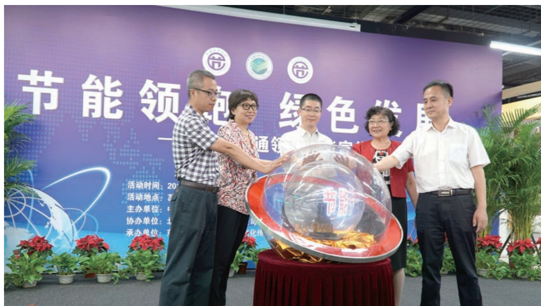
认证中心举办商务流通领域节能宣传周启动仪式

在北京，认证中心于2016年6月13日在苏宁易购联想桥云店举办了商务流通领域节能宣传周启动仪式。商务部、北京市商委、中国商业联合会、苏宁云商公司及认证中心有关部门负责人出席了启动仪式。活动以“节能领跑，绿色发展”为主题，通过现场讲解和发放节能节水小册子等方式，引导消费者选购获得认证的节能高效产品，提升消费体验。