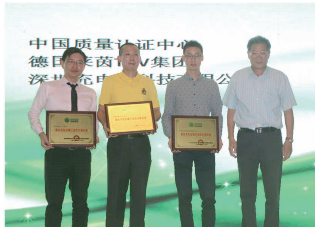
最佳充电设施行业综合服务商颁奖现场

2016年7月，认证中心在第五届深圳国际充电桩（桩）技术设备展览会上被组委会评为“最佳充电设施行业综合服务商”。作为新能源汽车的配套基础设施，国内充电桩建设正进入高速发展时期。认证中心一直致力于通过专业服务促进充电桩等相关设施的标准落地、政策实施和质量提升，陆续开发了充电设备、充电枪、充电电缆以及设备用非金属外壳等多个认证项目，并提供在充电站验收方面的技术服务。