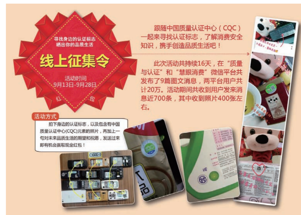
认证中心开展全国“质量月”线上宣传活动