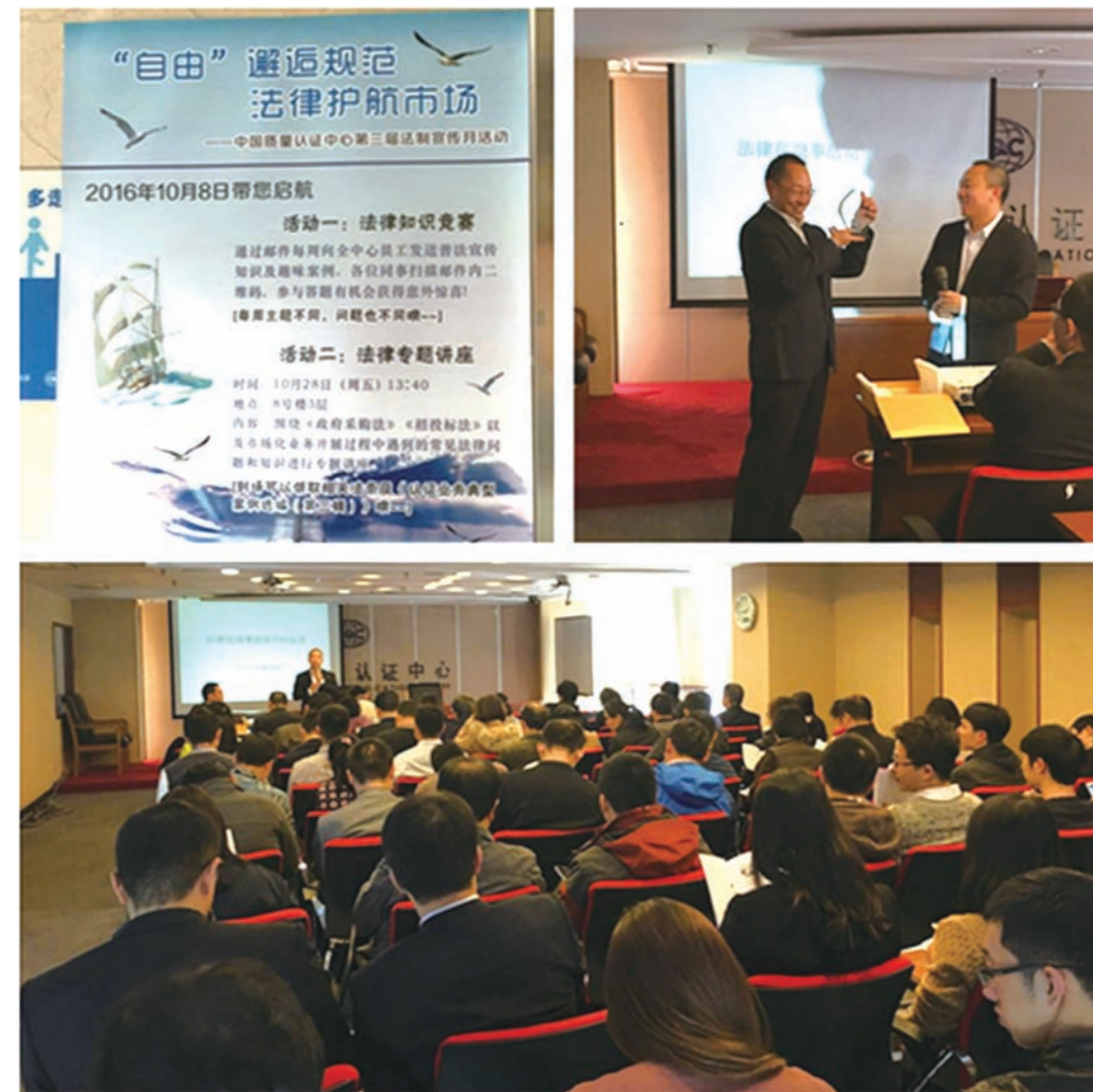
认证中心 2016 年法制宣传月

关题目，选取涉及业务开展、合同签订及招投标等方面的常见的法律问题，开展法制宣传工作，并通过知识竞赛形式加深普法宣传力度，起到法制宣传、教育的目的。