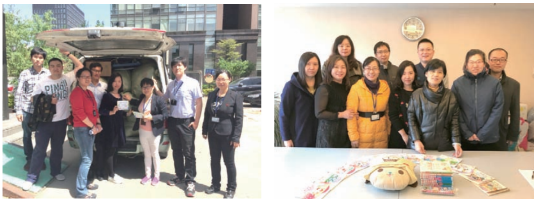
认证中心组织向“工友之家”的公益募捐活动

关注社会困难群体，认证中心持续发起公益募捐活动，共向“工友之家”捐赠衣物、书籍和文具等爱心物资 50 余包，这一关注社会困难群众的举动得到了社会各界的赞扬和肯定。