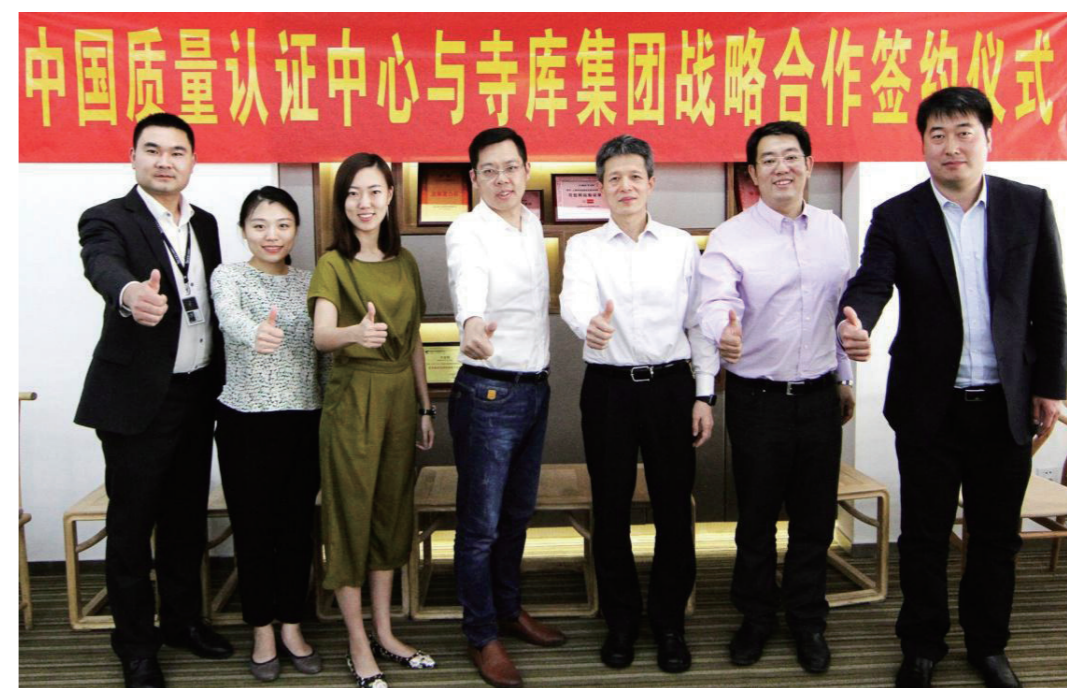
认证中心与寺库合作签署现场

电商领域 2016年4月，认证中心与寺库集团在京签署战略合作协议。寺库集团作为国内知名的电商企业，致力于打造全球高端消费服务平台。在未来的合作中，认证中心将对寺库集团及其关联公司开展长期性全方位的质量提升工作，提供良好的电子商务规范认证，同时双方将研究建立“高端服务评价认证体系”，制定行业规范及服务准则，推广行业认证工作，逐步形成一套涵盖零售领域、流通领域、服务领域等多领域的高端消费服务评价认证体系。