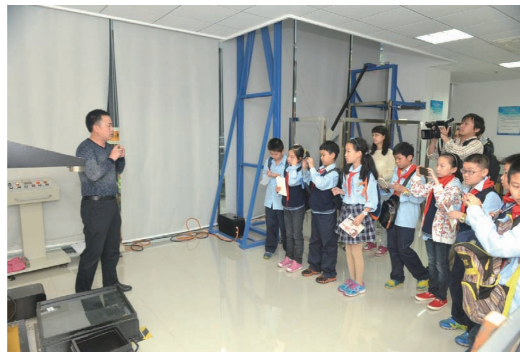
华中实验室举办“实验室开放日”活动

2016年5月20日-5月21日,认证中心华中实验室举办了“实验室开放日”活动。邀请企业代表、合作高校代表、东湖高新区有关政府和居民代表,以及40余名中小学师生参加活动,通过生动的讲解,宣传片播放、趣味实验的参观和动手参与,让参观者了解和学习到了“全球气候变化与碳排放”“我们生活中的碳排放”“如何研究生活中的碳排放”“善待地球,低碳生活”“生活中的玻璃使用安全”等各类实用科学知识。