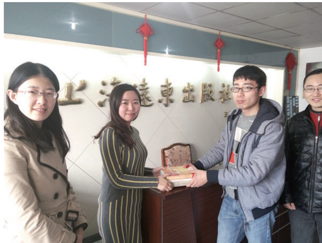
认证中心与远东出版社联合参与“点亮金桥”学雷锋活动

2016年3月2日, 值学雷锋日来临之际, 认证中心上海分中心党支部联合工会走访了上海世纪出版股份有限公司远东出版社, 就“点亮金桥”学雷锋活动与出版社相关负责人进行了交流, 感谢远东出版社为上海分中心定点捐助学校——江西西湖中心小学的“点亮金桥”阳光图书室提供的大量帮助, 并争取更多持续的捐助和支持。