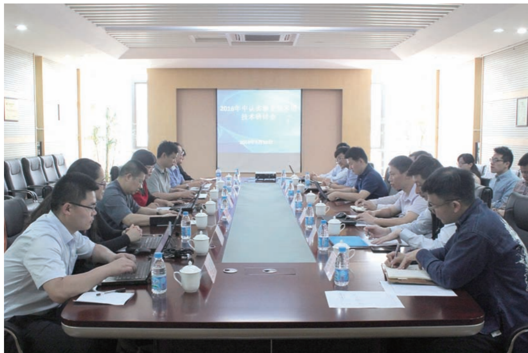
中认实验室技术组（WG1）首次技术研讨会

为进一步提高中认实验室的质量和水平，充分发挥检测技术对实验室业务的支撑作用，认证中心于2016年成立中认实验室技术组，并根据不同专业领域，分别成立WG1（电子、可靠性、电池、电磁兼容等）和WG2（家电、照明、电动机等）技术小组，中认实验室技术组将为构建和认证中心检测认证一体化服务能力发挥积极作用。