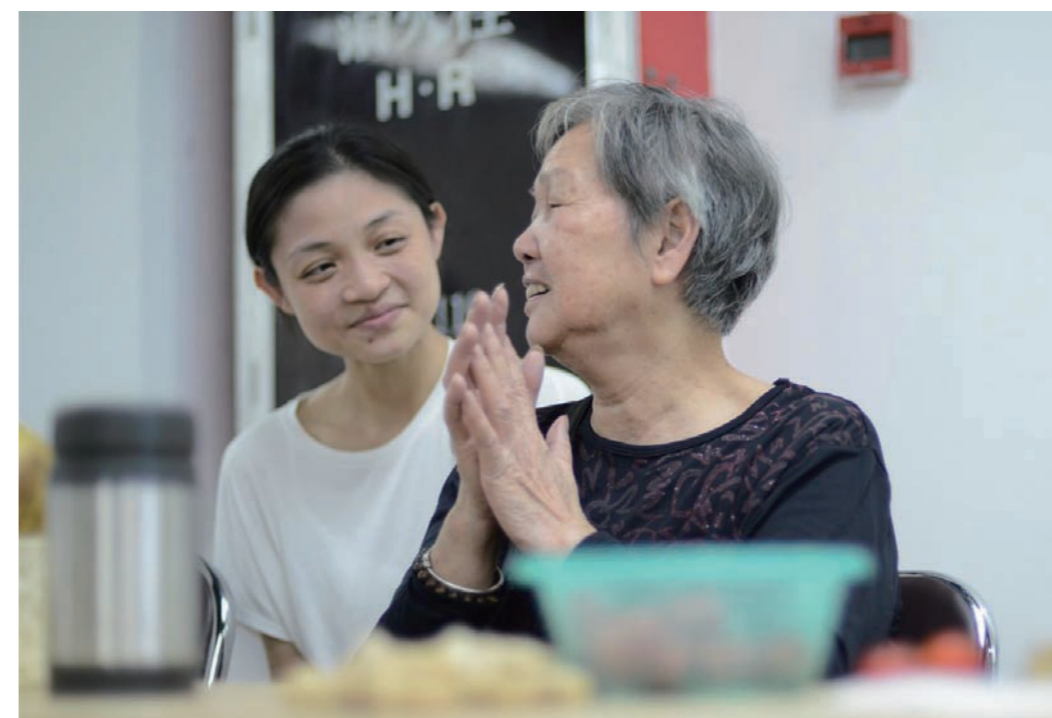
广州分中心志愿者与老人合影留念