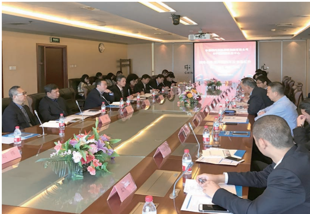
认证中心与中保研合作签署现场

保险领域 2016年10月，认证中心与中保研汽车技术研究院有限公司（以下简称“中保研”）在北京举行战略合作签约暨后市场配件认证项目启动仪式。建立汽车后市场配件认证和可追溯制度，是规范汽车后市场的重后市场、提升汽车修理服务质量、有效降低车险费率的关键支撑点，是落实国家部委相关文件的具体行动，双方将积极征求行业和社会的意见，吸取国际上汽车后市场零配件产品认证的经验，组织技术专家制定汽车后市场配件认证技术规范 and 建立认证流程，努力提高配件认证的客观性、科学性、严谨性和合规性。